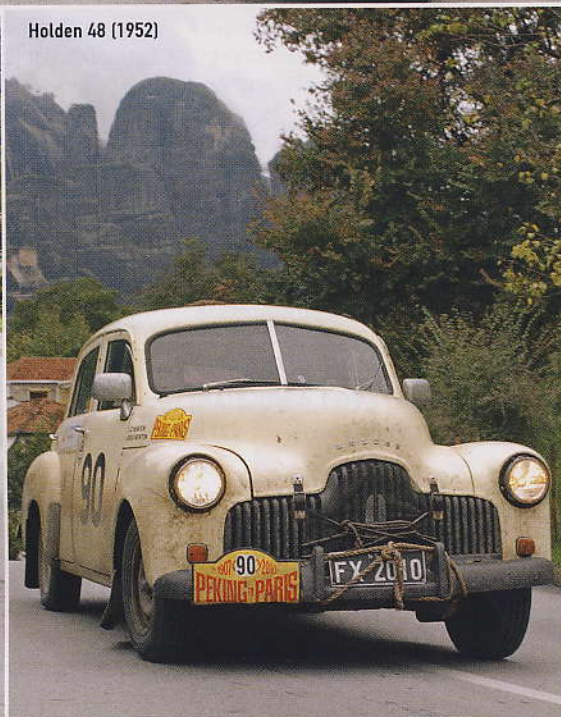
Holden 48 (1952)