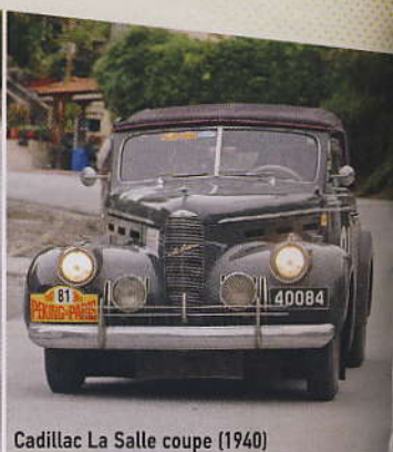
Cadillac La Salle coupe (1940)

A πό τη στιγμή που δόθηκε η εκκίνηση στο Πεκίνο, κάθε μέλος πληρώματος ξεκίνησε μια μοναδική εμπειρία, η οποία θα του παρέιχε αναμνήσεις για μια ζωή: τα περάσματα συνόρων κάτω από... περιπετειώδεις συνθήκες, τη φιλοξενία από ανθρώπους παντελώς άγνωστους, τον πόνο και την απόγνωση που προκαλούν οι αναπάντεχες βλάβες, αλλά και τον θρίαμβο των ως εκ θαύματος επισκευών. Την κατασκίνωση κάτω από τον έναστρο ουρανό των παρθένων περιοχών της Μογγολίας, αλλά και την οικογενειακή ατμόσφαιρα που παρέιχε η οργάνωση του αγώνα (το Endurance Rally Association E.R.A.), η οποία φρόντιζε σε κάθε στάση για τον ανεφοδιασμό των οχημάτων σε καύσιμο και των πληρωμάτων σε... φαγητό!