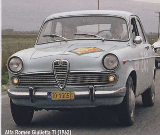
Alfa Romeo Giulietta TI (1962)

ΚΕΙΜΕΝΟ: ΚΩΣΤΑΣ ΔΗΜΗΤΡΕΛΗΣ