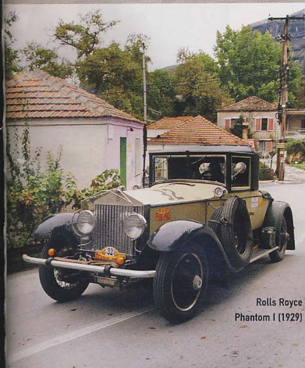
Rolls Royce Phantom I (1929)