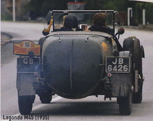
Lagonda M45 (1935)